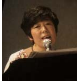
木村真紀 シンガーソングライター

東京音楽大学作曲科卒業。師である三枝成彰氏薦められCMソングを歌ったのをきっかけにプロに。以来、CMやゲームミュージックなどを手掛ける。映画、ものけ姫「たたらふみうた」、NHK「おかあさんといっしょ」のぼわわぶ体操の歌など話題作も多い。2000年、日本コロムビアよりソロアルバム「涙」をリリース。以降、精力的にライブ活動も行い、母として人としての様々な歌い、発信し続けている。